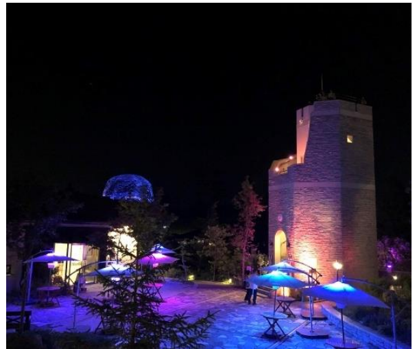
Summer Lighting Night Cafe 開催時の様子