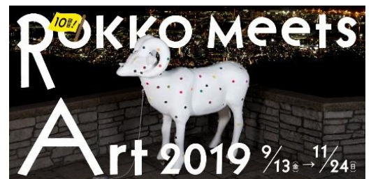
big horn sheep-palette 展示イメージ