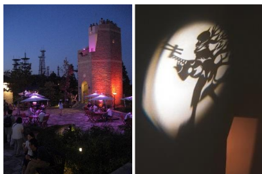
(左)見晴らしの塔 (右)見晴らしの塔内照射イメージ

今年は「蜘蛛の糸」をテーマとした光と影の物語の演出を予定しており、それに先立って8月10日(土)からは、見晴らしの塔内部の螺旋空間に、物語の登場人物を照射します。塔の内部の照射は、日中もご覧いただける予定です。