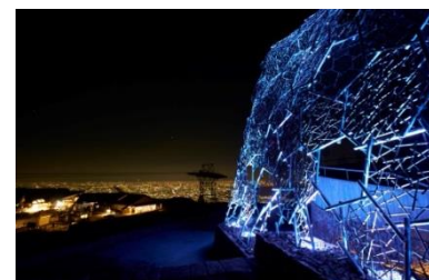
Lightscape in Rokko 夏バージョン「夏は夜」