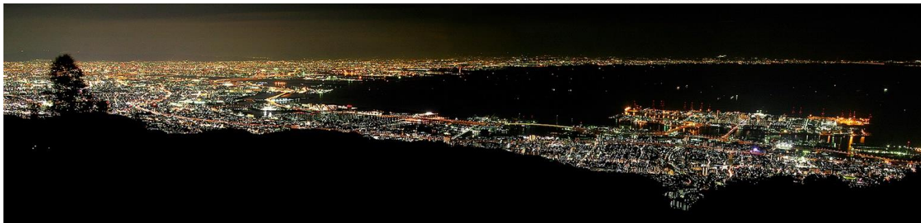
六甲ガーデンテラスから望む「1,000万ドルの夜景」

北海道函館市にある函館山からの夜景と六甲山系の1つである摩耶山掬星台からの夜景は、どちらも「日本三大夜景」に選定されており、六甲山からの夜景は「1,000万ドルの夜景」として広く知られています。特に、最大標高888mの「自然体感展望台 六甲枝垂れ」から望む美しい夜景は格別で、アーティスト・伏見雅之氏の演出によるライトアップイベント「Lightscape in Rokko しょくぶつのあかり」も合わせて楽しめます。