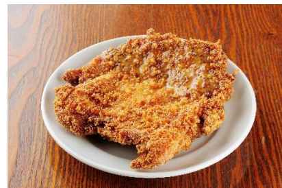
でっかいどうザンギ 1,000円