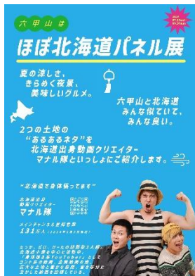
ほぼ北海道パネル展 ビジュアルイメージ

また、8月4日(日)、18日(日)には六甲山牧場からミニチュアホースのサニーくんが来場し、六甲おみやげ館周辺のねり歩きや、エサやり体験を実施します。 ※雨天時は順延予定。時間等の詳細は決定次第、HPでお知らせいたします。