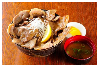
北海道塩豚丼(表六甲) 2,000円