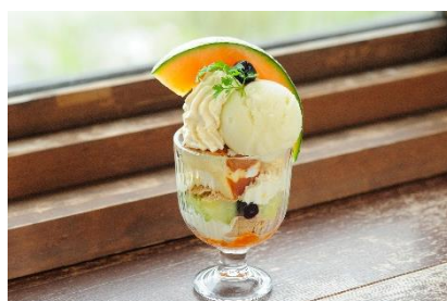
キングメルティジェラートと とうきびクリームのみロンパフェ 1,800円