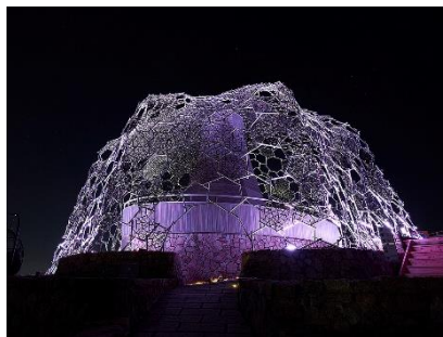
ライトアップされた六甲枝垂れ