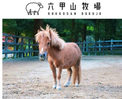
ミニチュアホースのサニーくん