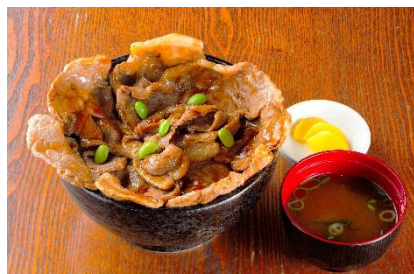
北海道豚丼(表六甲) 2,000円

六甲ガーデンテラス内の3つの飲食店舗およびテイクアウトコーナーでは、北海道にまつわる様々なメニューをご用意しています。各店舗には、神戸・大阪の眺望が楽しめる座席を多数ご用意しておりますので、絶景と共にお楽しみください。 ※全て税込価格です。各店舗のメニューは仕入れ状況により、一部内容を変更する場合があります。画像はイメージです。