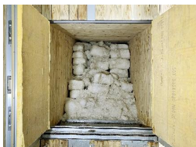
2024年3月4日時点の氷室の様子

六甲ガーデンテラスは8月の最低気温が20度で、函館とほぼ同じ※で過ごしやすく、夏の避暑地としても有名です。六甲枝垂れでは、冬に氷を貯蔵した「氷室(ひむろ)」の扉を開放して六甲山上に吹く風を取り入れる「氷室開き」を7月13日(土)に実施する予定で、展望台内部の「風室(ふうしつ)」では氷室の氷が無くなるまで、 神戸市街地と比べてマイナス約10度の涼が楽しめる「冷風体験」 を開催します。 ※2023年8月の函館と六甲山の最低気温20℃(自社調べ)