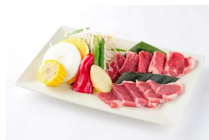
北海道ラムランチ 3,500円