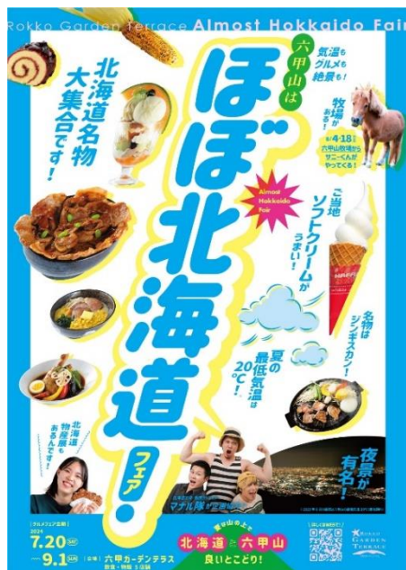
ほぼ北海道フェア ビジュアルイメージ