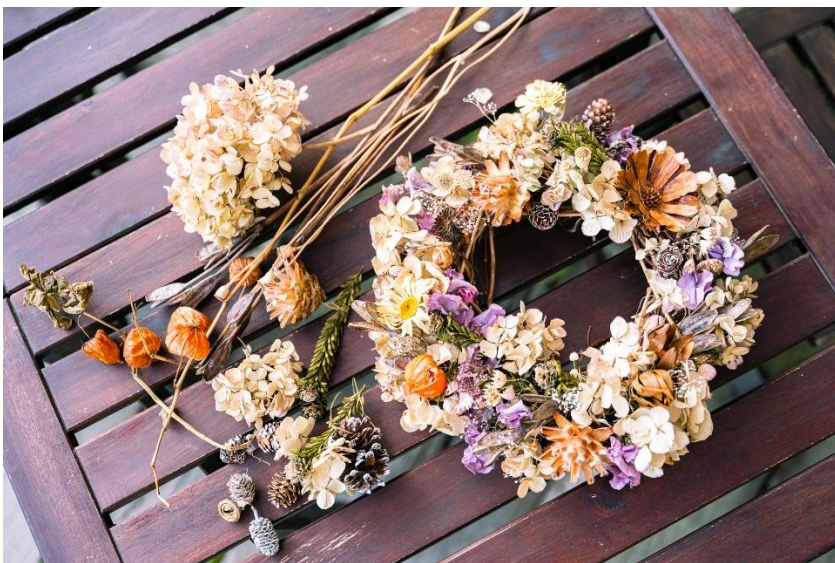
左:リースの材料 右:秋色のリース(イメージ)

六甲山観光株式会社(本社:神戸市灘区 社長:寺西公彦)が運営する、ROKKO森の音ミュージアム内、「SIKI ガーデン～音の散策路～」(以下、SIKI ガーデン)で、2024年10月18日(金)に「森の音フラワーアレンジメント 秋色のリース作り」を開催します。