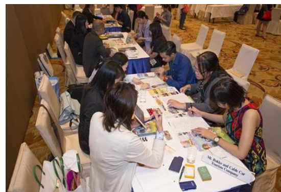
タイの旅行博で旅行会社に営業する様子