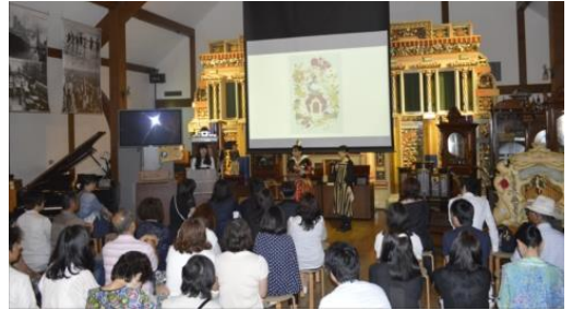
六甲オルゴールミュージアム 訪日外国人来館時の様子(写真中央:オルゴール組立体験 写真右:コンサート鑑賞)