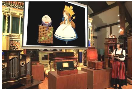
特別展 上演の様子(イメージ)

『鏡の国のアリス』は、1871年に発表されたルイス・キャロルの児童文学で、『不思議の国のアリス』(1865年)の続編です。本展ではスクリーンに投影されるアリスのイラストと19世紀末頃に全盛期を迎えていたオルゴール等の自動演奏楽器の音色を通し、物語の描かれた時代の空気感を再現します。