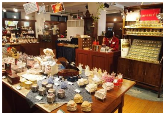
ミュージアムショップ時音(とおん)